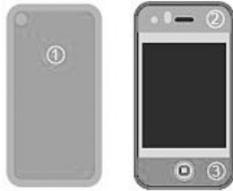
Hinweise zur Anbringung